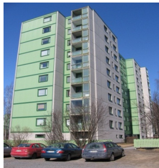
Tuirantie 11 Oulu