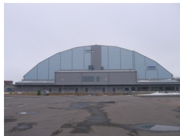
Heinäpään palloiluhalli Oulu