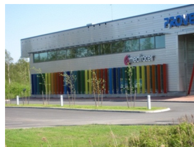
Proventia House Oulunsalo